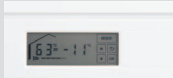
Dijital göstergeli dokunmatik kontrol paneli

Vitodens 100-W, farklı kapasitelerdeki yüksek kaliteli model seçenekleriyle her türlü bireysel ısıtma ihtiyacına cevap verebilmektedir.